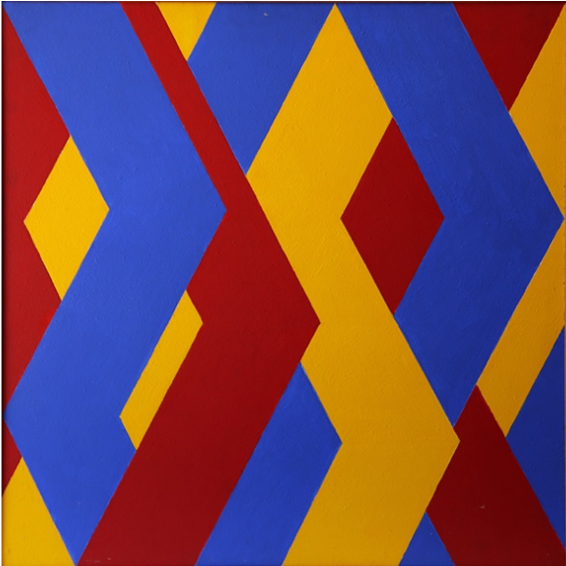
Sin título , 1994. Según boceto de 1962. Acrílico sobre hard board. 60 x 60 cm

Se irá imponiendo la relación matemática y simétrica; se irá perdiendo el concepto de figura / fondo; se irán consolidando los colores primarios y secundarios, el marco cuadrado, la sección aurea y las figuras abstracto/geométricas.