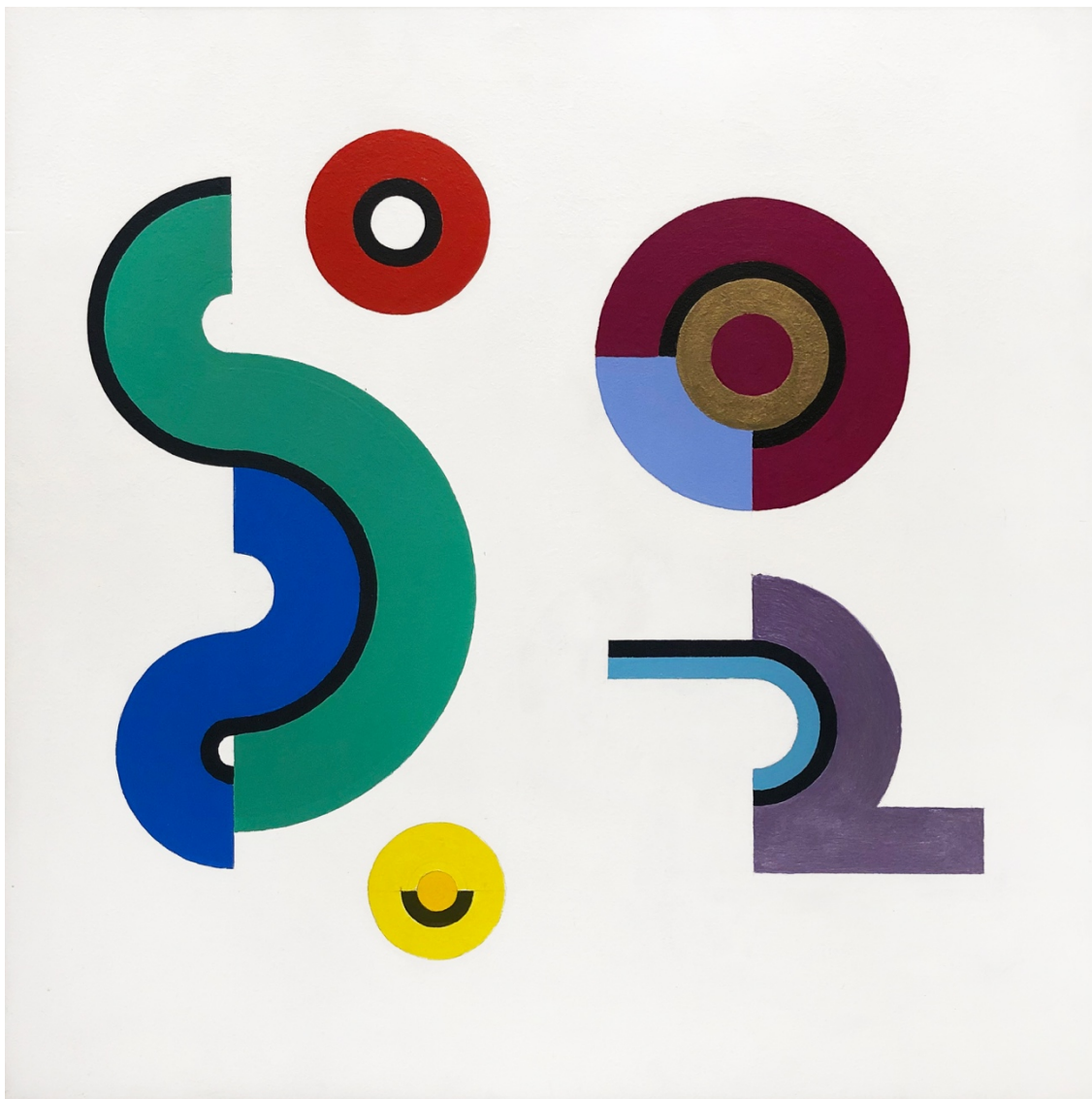
Constelación 2 , 1994. Acrílico sobre hard board. 60 x 60 cm

Herlitzka + Faria Libertad 1630 - Buenos Aires C1016ABH Tel.: + 54 11 4313 2993